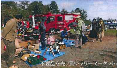
不要品を売り買いフリーマーケット