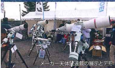
メーカー天体望遠鏡の展示とデモ