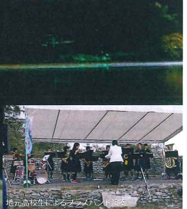
地元高校生によるフラッシュカード制作

主催：こうみ星フェス実行委員会 後援：小海リエックスホテル、小海町、小海町観光協会、小海町教育委員会 北ハケ岳小海星と自然のフェスタ公式ホームページ： https://koumi-starfes.com/