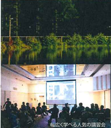
幅広く学べる人気の講習会