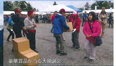
豪華賞品が当たる大抽選会