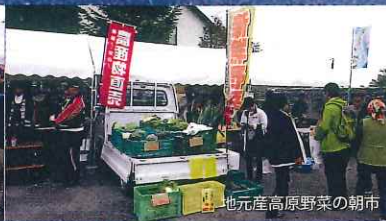
地元産高原野菜の朝市