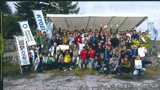
出展、参加者による記念写真