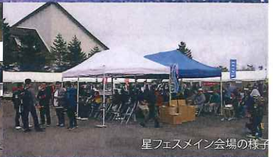
星フェスメイン会場の様子