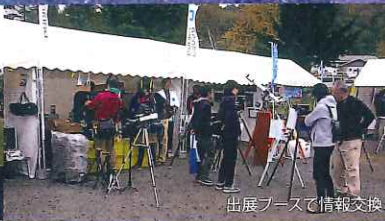
出展ブースで情報交換