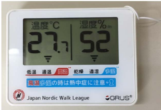
デジタルポータブル温湿度計

当連盟では今期より公認指導員の教室、体験会、講習会を実施する際には本計器を提示し「本日の気温〇〇度、湿度〇〇%に付き熱中症危険度が〇〇%なので水分補給をこまめに実施すると共に十分気をつけてスタートしましょう!という注意喚起をスタート時に必ず行うことといたしましたのでJNWL公認指導員の皆様方におかれましては携行いただくようお願い申し上げます。