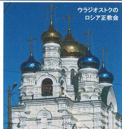
ウラジオストクの ロシア正教会